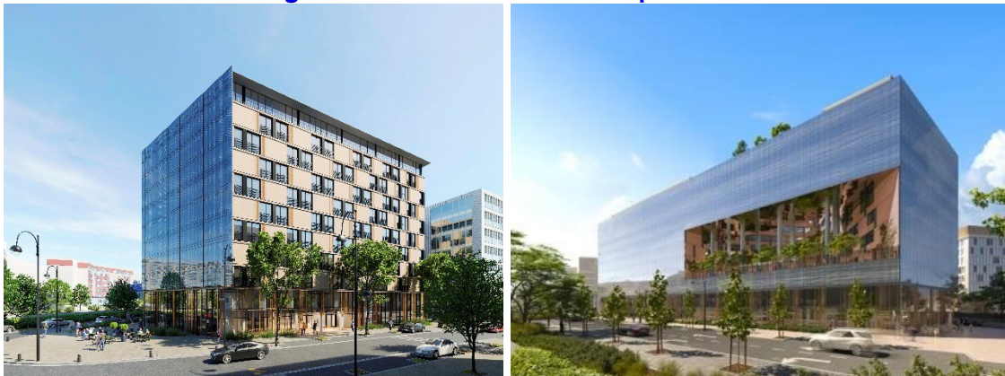
Perspectives du projet à Rueil-Malmaison © Agence Bechu associé

Situé dans le quartier « Rueil 2000 » au cœur de la ville de Rueil-Malmaison, ce nouveau projet vise à recycler un immeuble de bureaux datant des années 1990 en une résidence d'hébergements hôteliers de courtes et longues durées. Grâce à cette opération, Novaxia Développement vient répondre à une double problématique : la vacance croissante de bureaux en Ile-de-France et la pénurie d'hébergements sur ce territoire.