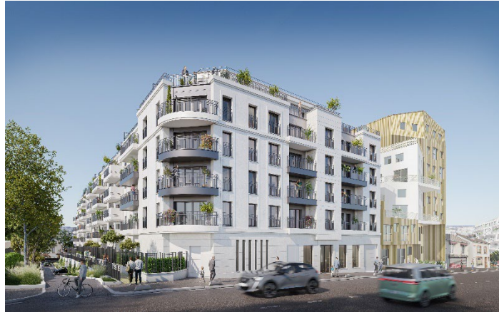
Projet de logements financés par Novaxia R, à la place de bureaux obsolètes (actuellement en phase de travaux) à Aubervilliers (93)

Le logement étant responsable de 70 % de l'artificialisation des sols en France 2 , Novaxia R permet de créer du logement en allant au-delà de la « Zéro Artificialisation Nette », c'est-à-dire en profitant du processus de recyclage urbain pour créer de la pleine terre et ainsi renaturer la ville. En plus du label ISR, Novaxia R est labellisé Fair-Finansol (label solidaire), ce qui signifie que 5 % de sa collecte est directement investie dans l'immobilier solidaire, comme la mise à disposition de logements à loyers décotés pour les soignants ou d'espaces gratuits pour les acteurs de l'économie sociale et solidaire ou les structures à impact. Novaxia R est également classifié Article 9 au sens de la réglementation SFDR, soit le plus haut niveau de la finance durable en Europe. La réglementation SFDR (Sustainable Finance Disclosure Regulation), entrée en vigueur en Europe en 2021, vise à favoriser la transparence des produits financiers.